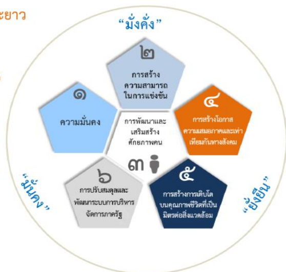
ความเชื่อมโยงของยุทธศาสตร์ชาติกับแผนในระดับต่างๆ

เพื่อให้บรรลุวิสัยทัศน์ “ประเทศไทยมีความมั่นคง มั่งคั่ง ยั่งยืน เป็นประเทศพัฒนาแล้ว ด้วยการพัฒนาตามปรัชญาของเศรษฐกิจพอเพียง” นำไปสู่การพัฒนาให้คนไทยมีความสุข และตอบสนองต่อการบรรลุ ซึ่งผลประโยชน์แห่งชาติ ในการที่จะพัฒนาคุณภาพชีวิต สร้างรายได้ระดับสูงเป็นประเทศพัฒนาแล้ว และสร้างความสุขของคนไทย สังคมมีความมั่นคง เสมอภาคและเป็นธรรม ประเทศสามารถแข่งขันได้ในระบบเศรษฐกิจ