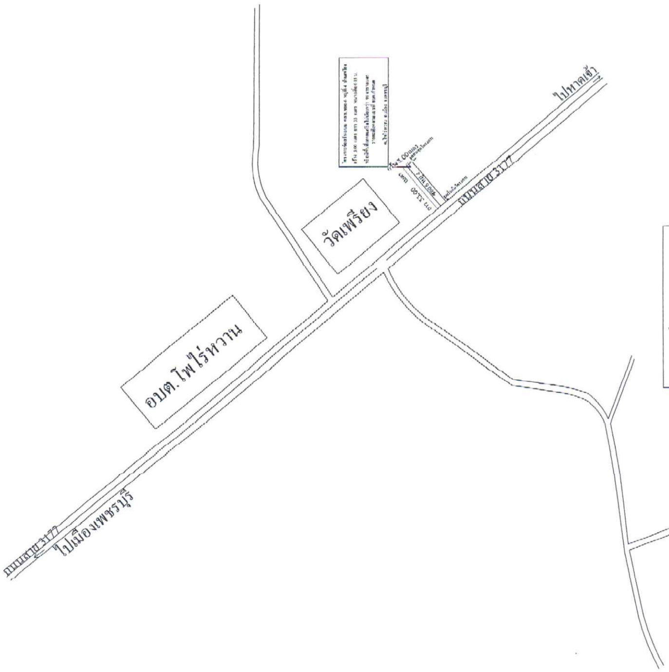
แผนที่โดยสังเขป