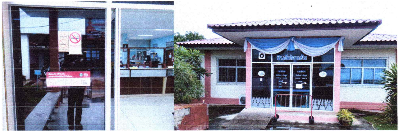
อาคารสำนักงานองค์การบริหารส่วนตำบลโพไร่หวาน