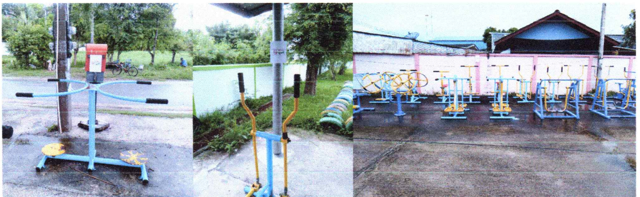
ลานกีฬา หมู่ที่ ๑ - ๗