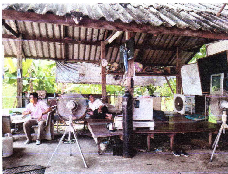
ทำอาคารเอนกประสงค์องค์การบริหารส่วนตำบลโพไร่หวาน