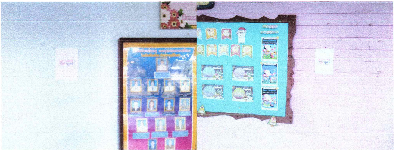
โรงเรียนวัดเพรียง โรงเรียนบ้านป้อหวาย