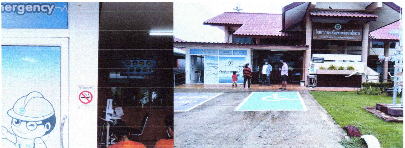
โรงพยาบาลส่งเสริมสุขภาพตำบลโพไร่หวาน