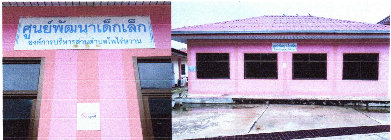
ศูนย์พัฒนาเด็กเล็กองค์การบริหารส่วนตำบลโพไร่หวาน